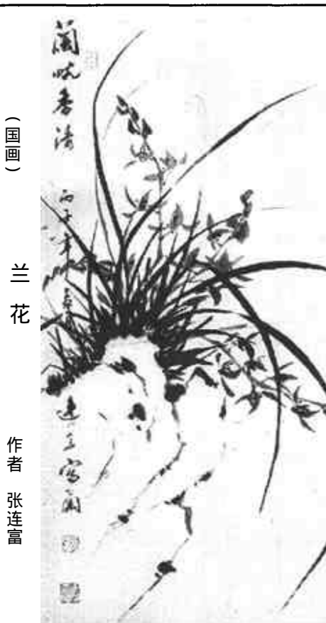
兰花 作者 张连富

人生如画，面对生命的画卷，你有没有比今生更美好的梦境？在深夜中面对对空虚的我，我依然傍着生命的轨迹滑行在人生的旅程，可是我找不到驿站。回首旅程，以后，会不会像我们读书一样，阅完一页后，还有更精彩的一页？今生以后是来生？ 面对清风繁星，心中千转百回的，那个美丽的诺言流淌着温情，青青翠翠的年华日子，却流露着“碧云天，黄花地”的伤感，想告诉自己的依然是“画外一个怎样的生命故事在悄然延续”。 生命，一道美丽的风景线。可也有人说天堂很美，但那里住着上帝。可我没有